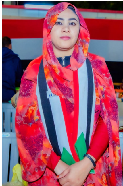
تجارة الثياب السودانية والبضائع المتنوعة.

وشهدت الفعالية حضور عدد من الشخصيات المعروفة، من بينهم الإعلامي والمذيع بتلفزيون السودان محمد جمال الدين، إلى جانب الشاعر عبدالعظيم الصديق الخضب المعروف بـ«سوداني سوداني»، أحد الوجوه الدائمة في أنشطة المركز الثقافي منذ 2014، والمهتمين بالجانب الإنساني والثقافي.