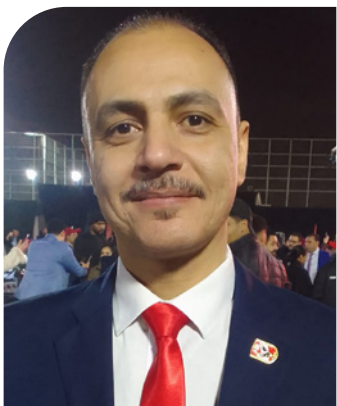
المستشار عصام غيث