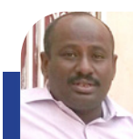
علي كورينا - أكشن سبورت

غير أن الاصطدام بالهلال في الجولتين الثالثة والرابعة غير المشهد بالكامل. توقف رصيد صن داونز عند خمس نقاط في المركز الثاني، مع بقاء مباراة صعبة أمام سانت لوبوبو في لومباشي