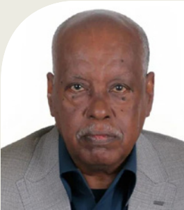
عبد المنعم هلال

وأكد السفير أن "الشعب السوداني يقف مع قواته المسلحة في خندق واحد"، وهي ليست عبارة خطابية عابرة، بل تعبير عن حقيقة وطنية سامية، ووثيقة عهد بين جيش وطني يحمل راية الدفاع عن سيادة الوطن ووحدته، وشعب يدرك أن أمنه واستقراره لا يصونهما إلا التلاحم الوثيق مع قواته المسلحة. إنها رسالة واضحة للعالم بأن إرادة السودانيين في الحفاظ على كيان