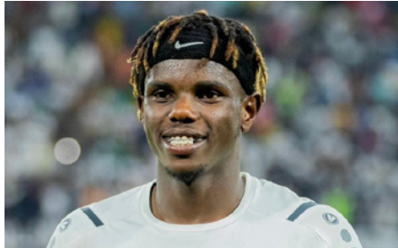
كيجالي - أكشن سبورت