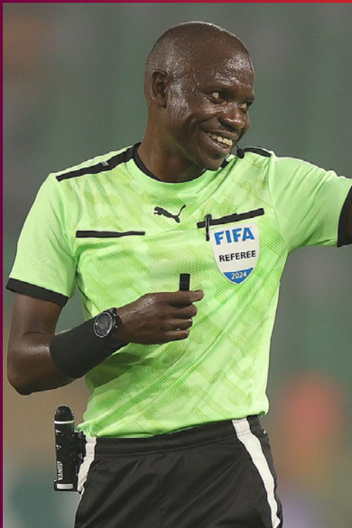
الرباط - أكشن سبورت

عين الاتحاد الأفريقي لكرة القدم الحكم الكونغولي جون جاك ندالا لقيادة مباراة المنتخب المغربي أمام نظيره السنغالي، في نهائي كأس أمم أفريقيا 2025، وهو الحكم نفسه الذي أدار المباراة الافتتاحية بين المنتخب المغربي وجزر القمر. وتجرى المباراة اليوم الأحد على أرضية ملعب الأمير مولاي عبد الله بالرباط، عند الساعة التاسعة مساءً بتوقيت السودان.