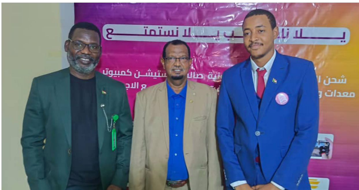
الخرطوم - أكشن سبورت

التي أسفرت عن تتويج البطل بكأس البطولة، إلى جانب منح الميدالية الفضية لصاحب المركز الثاني، وتوزيع جوائز مالية للمشاركين في الأدوار المتقدمة. وأكد الوزير، في كلمته، دعم وزارته الكامل للرياضة الإلكترونية، مشيراً إلى أنها تمثل أحد ملامح مستقبل الشباب والتحول الرقمي، داعياً إلى تنسيق الجهود لاعتماد هذه البطولات رسمياً ضمن المنظومة الرياضية للدولة. من جانبه، أشاد مدير الإدارة العامة للشباب،