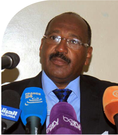
مجدي شمس الدين